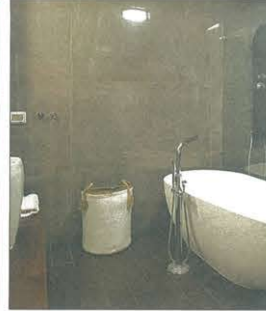
חדר אמבטיה של חוש. מקום שבו אפשר להעז בעיצוב ולהתחדש לעתים קרובות