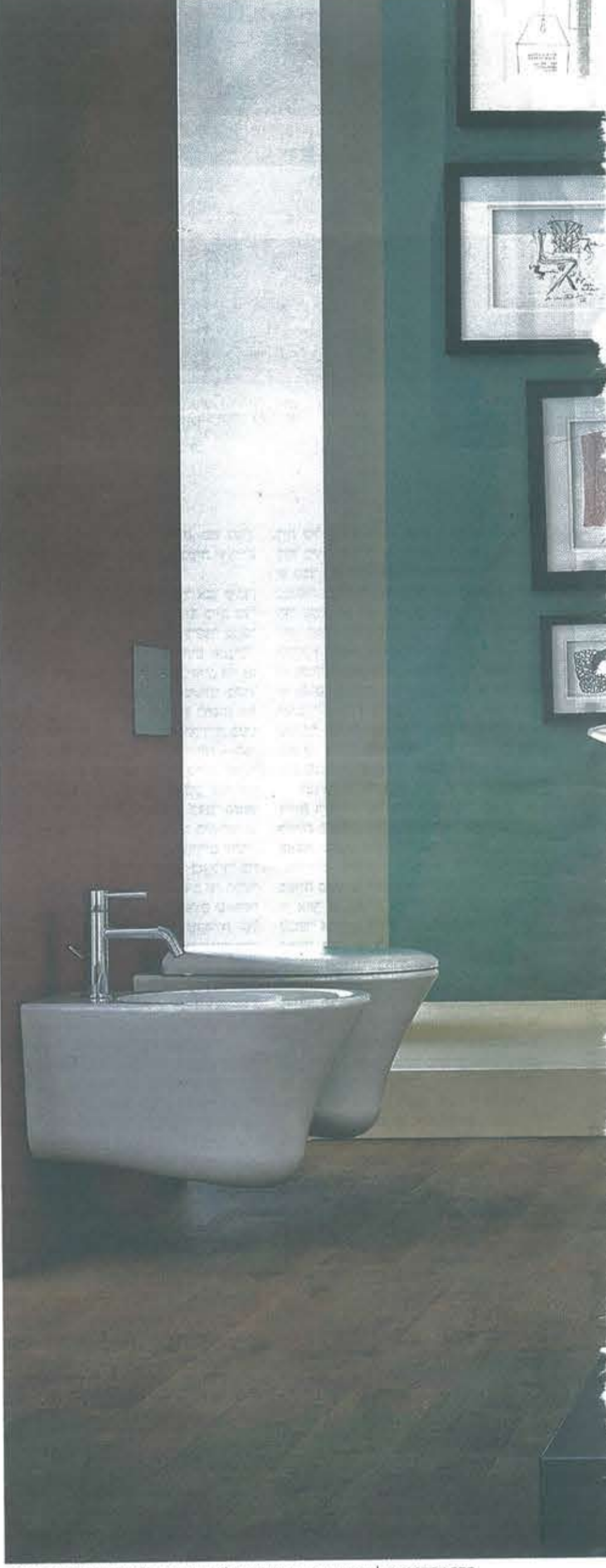
חדר אמבטיה של חוש. מקום שבו אפשר להעז בעיצוב ולהתחדש לעתים קרובות

יפה זה לא תמיד פרקטי מי שלא מסוגל להתנתק מוכן המקלחת מהטלוויזיה או מחדרי האמבטיה ברמת נהובת החכם מגיע עם מוצרי האמבטיה ברמת נהובת מיוחדים. רמקולים עמומים חיים וגם באמצעות ירוק, גם באמצעות עמודים חיים וגם באמצעות אריחים מצוירים. הגממה האקולוגית משתלבת